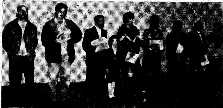
Câștigătorii secțiunii de interpretare a festivalului de satiră și umor „Liviu Oros”