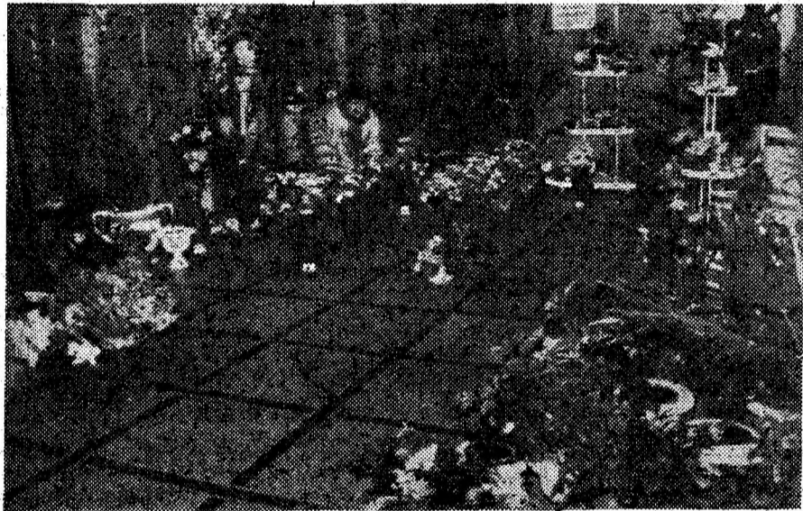
„Expoziția floricolă de primăvară” a R.A.G.C.L. Petroșani.