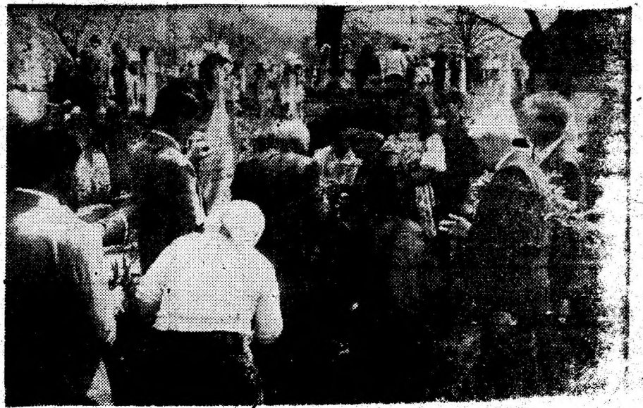
În după-amiaza zilei de duminică, la slujba de vecernie au fost pomeniţi viii şi morţii pentru iertarea păcatelor.