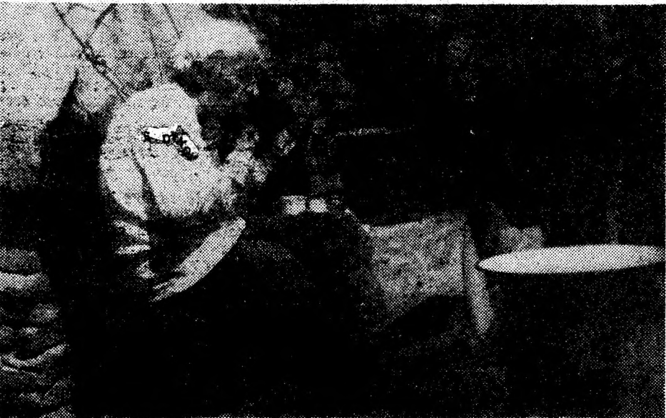
Bărbieritul de duminică.

Anul VII Nr. 1375 • Sâmbătă, 6 — Duminică, 7 mai 1995 8 pagini • 150 lei