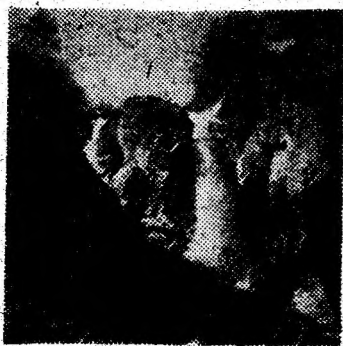
Cascada Lolaia

Șura Mare de la Ohaba Ponorului, numită și Peștera Mare, se află situată la nord-est de satul Ohaba. Această peșteră este marcată de o despăcătură uriașă în stânca de calcare jurasice. Pe aici iese pârâul Ponor, afluent al Streului, care reprezintă o resurgență puternică, cu o rețea hidrografică încă puțin cunoscută. Această peșteră a fost explorată pe o lungime de aproape 2 km de către cercetătorii Institutului de Speologie din București. La 120 m de la intrare se află o sală mare care a servit, așa cum o dovedesc resturile de ceramică neolitică, de refugiu omului primitiv. Recent a fost descoperită o imensă colonie a celui mai mic liliac cunoscut în Europa (Pipistrellus pipistrellus).