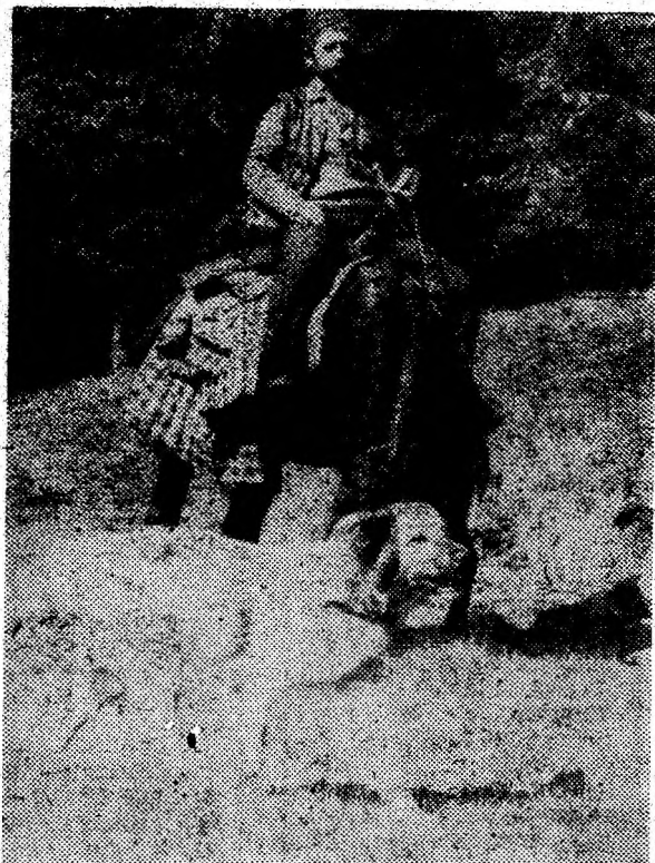
Pe drumuri de munte.