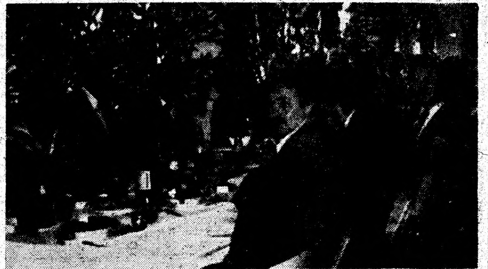
Lucrările Reuniunii s-au încheiat cu o masă festivă la baza nautică Șoimuș.