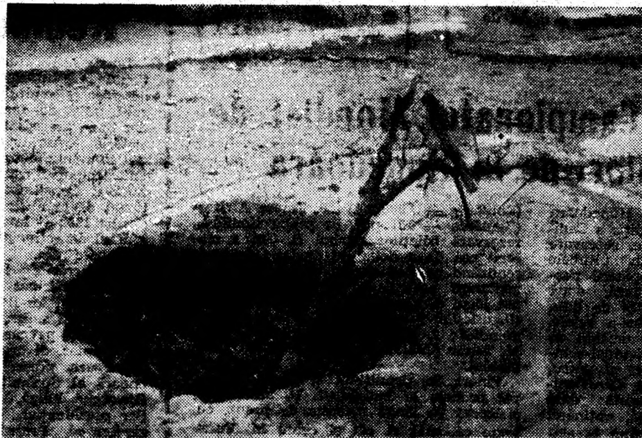
Actualmente, așa este semnalizată groapa din intersecția străzilor M. Eminescu și Bejan din Deva.