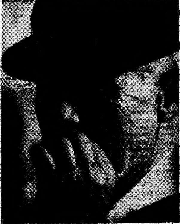
„Moșul nostru“.

lunga dumnealui scrisoare. Rânduri în care a adunat nemulțumiri și durere, de-a lungul vremii, dar și amintiri nostalgice și gânduri frumoase pentru cei care au fost cândva atât de corecți și de buni. De fapt, acei oameni n-au făcut altceva decât să-și respecte profesia și propria persoană. Așa cum ar trebui să se întâmple și în prezent. Și se întâmplă, dar nu peste tot, din păcate. Să trăim cu speranța că vom depăși aceste situații, că