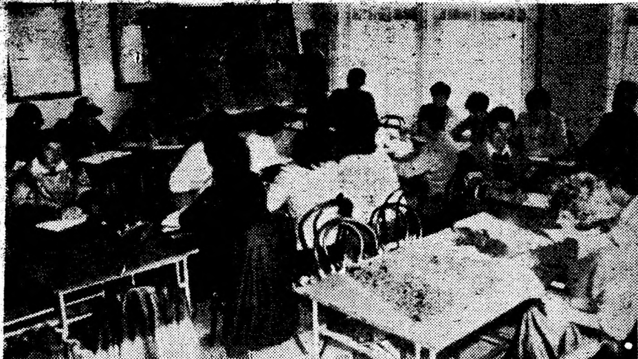
Cursurile Universității Populare din cadrul Casei de Cultură Deva rețin atenția unui număr tot mai mare de localnici, prin rosturile lor informative, prin calitatea predării și materialul didactic pus la dispoziție.