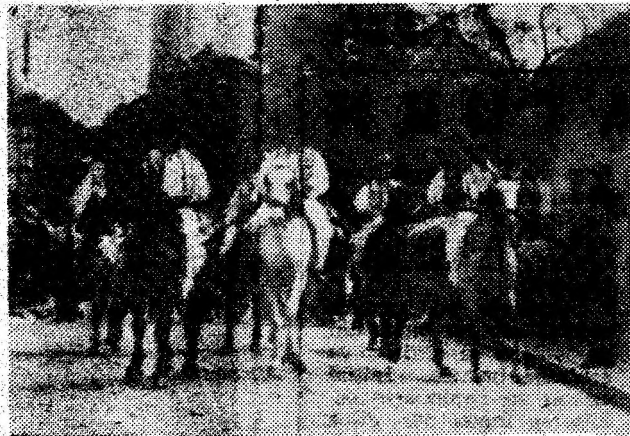
Imagine de la o ediție a Festivalului pădurenilor, care anul acesta se va desfășura la Poienița Voinii.

În momentul de față, satele comunei Bunila sunt total izolate din