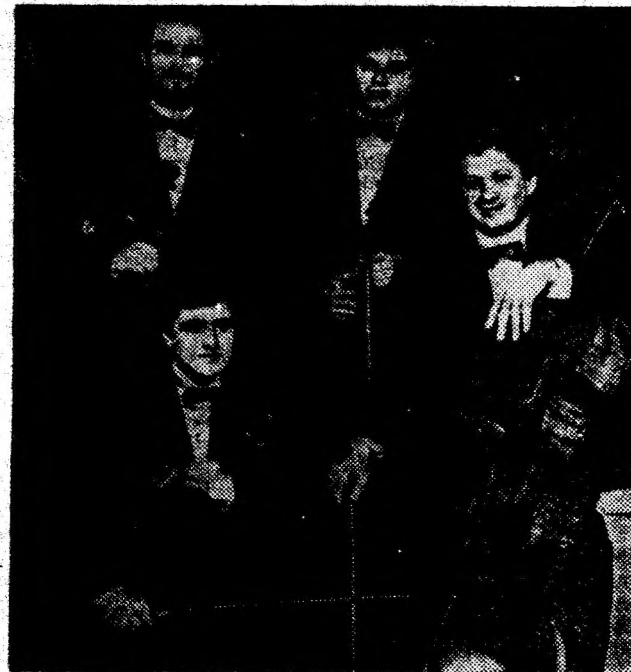
Unul dintre cele mai apreciate cvartete din lume: „Cvartet transilvan” din Cluj-Napoca.