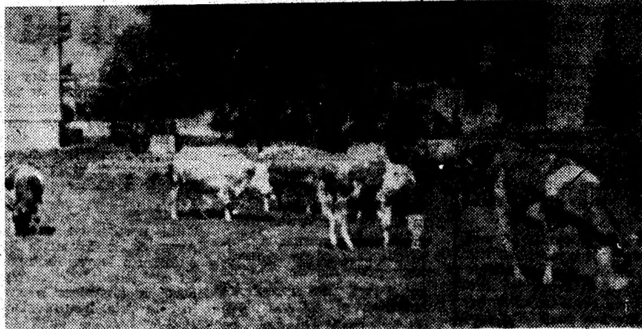
Animale din miniferma zootehnică a Grupului Școlar Agricol Geoagiu.