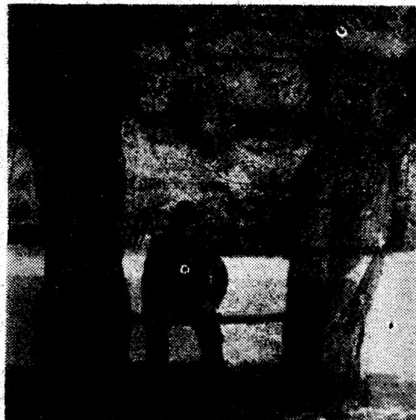
Popas. În drum spre Cioclovina, unde se duce la vaccinarea porcilor, asistentul veterinar Pătruț Marcu își trage răsuflarea.