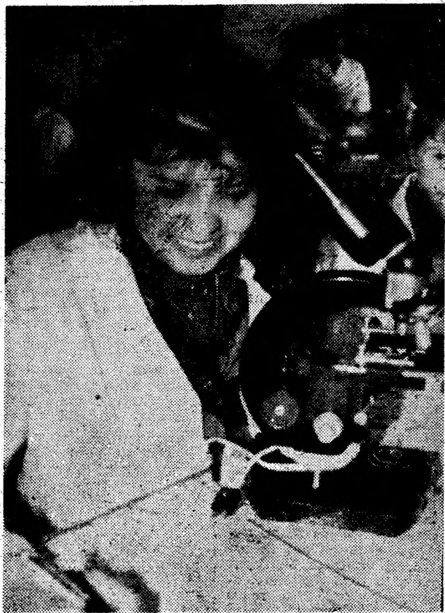
Oră de laborator la Grupul școlar agricol Geoagiu.