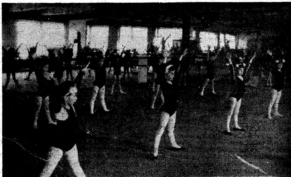
Casa de Cultură Deva: „Primii pași“ spre balet și artă.