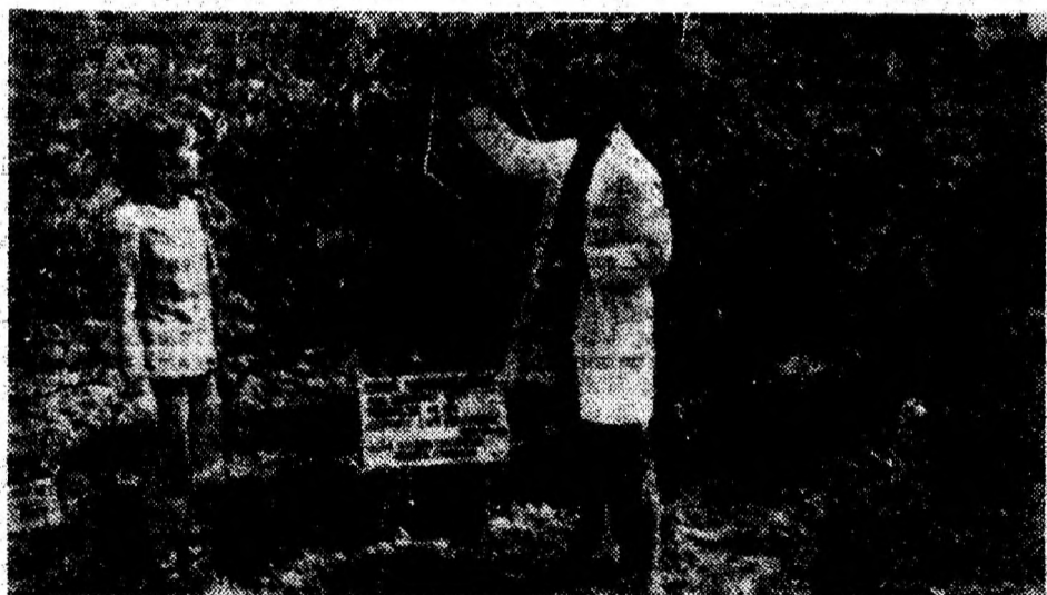
Viitorii pomicultori se pregătesc cu sârguință. În acest scop la Grupul Școlar Agricol din Geoagiu se pune un accent deosebit și pe aplicațiile practice.

O soluție pentru a opri invazia pășunii respective ar fi și propunerea ca, în apropierea vechiului furnal de la Govăjdia, să fie amenajată o parcare, oprind trecerea automobilelor peste Valea Runcului. Dacă această variantă nu este posibil de aplicat, se așteaptă o altă măsură, mai eficientă, care să-i apere și pe crescătorii de animale din zonă.