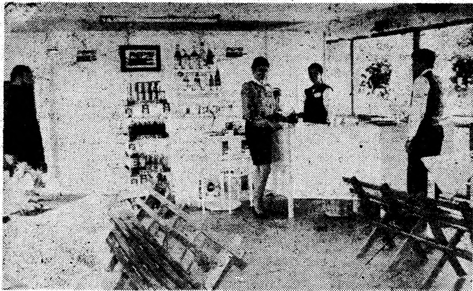
Calitate și bună servire — deviza lucrătorilor firmei S.C. Acal Prod Comimpex S.R.L. Deva.

În comuna Beriu privatizarea are teren propice pentru întreprinderii particulare. Mulți au deschis buticuri, cârciumi ș.a., dar sunt numeroși și cei ce au înființat activități de producție sau de prestări servicii. La ora actuală, în localitate funcționează două brutării, carmangerie, rotărie, fierărie, tâmplărie, două gateri, un atelier de sculptură în marmură ș.a. (Tr. B.)