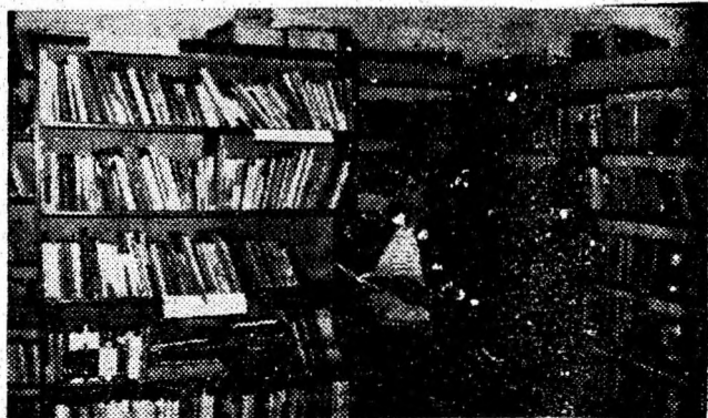
Aspect din Biblioteca comunală Boșorod.