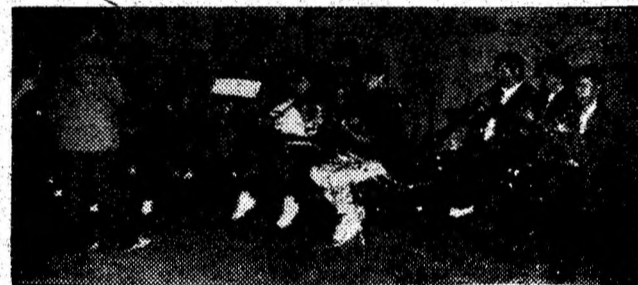
Repetiții la taraful Casei de cultură din Deva