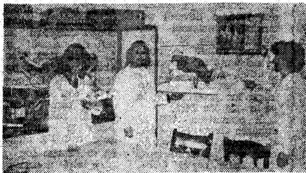
La Grupul școlar agricol din Geoagiu se depun strădanii permanente pentru a asigura o pregătire cât mai bună viitorilor tehnicieni în domeniul zootehniei, cărora le dorim să ajungă adevărați fermieri.