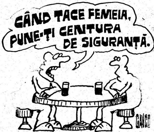
Desen de CONSTANTIN GAVRILA