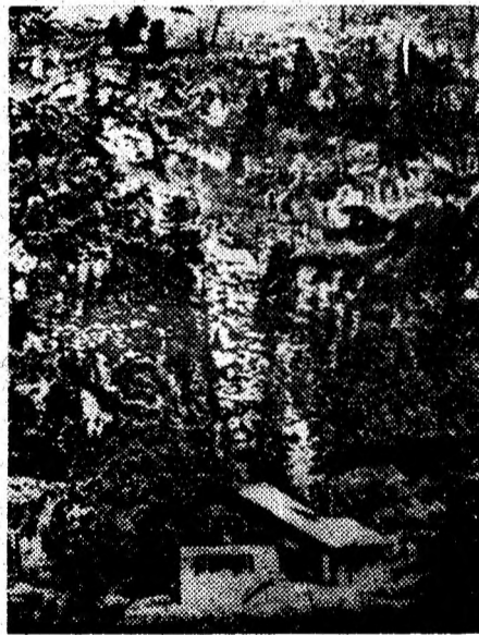
Retezat. Casa laborator Gemenele.

La 5 iunie, în fiecare an, se sărbătorește în toată lumea Ziua Mondială a Mediului, prilej de a trece în revistă etapele care au condus la declanșarea unui proces unic în istoria omenirii, acela de elaborare sub egida Națiunilor Unite a unei strategii de tranziție la dezvoltarea durabilă și de protejare a mediului înconjurător.