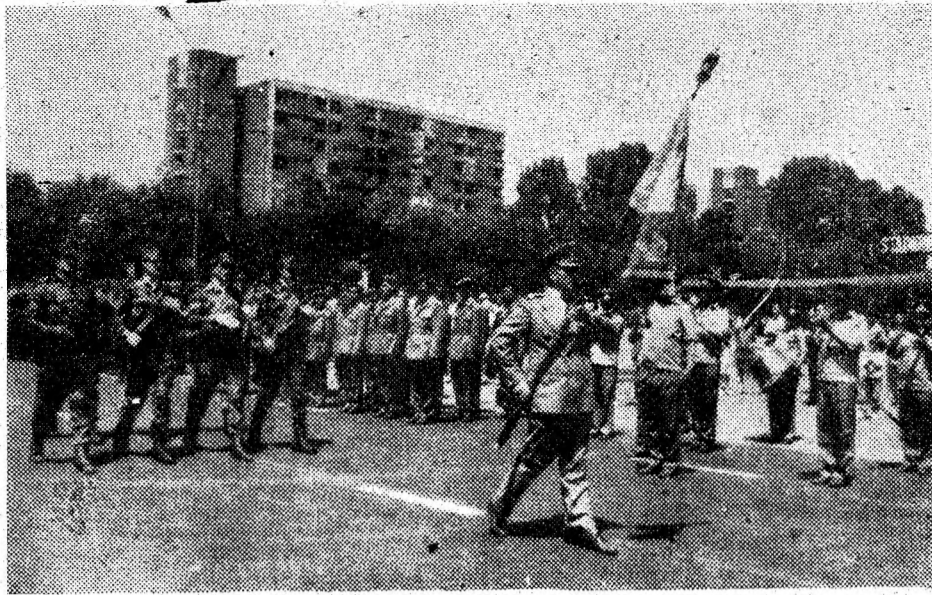
Solemnitatea înmânării Drapelului de luptă.