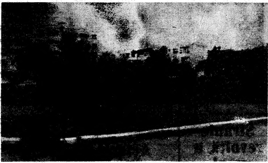
Vața de Jos. Zone verzi, prea verzi încât este nevoie din când în când de o coasă.