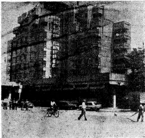
Deva, hotelul „Sarmis”.