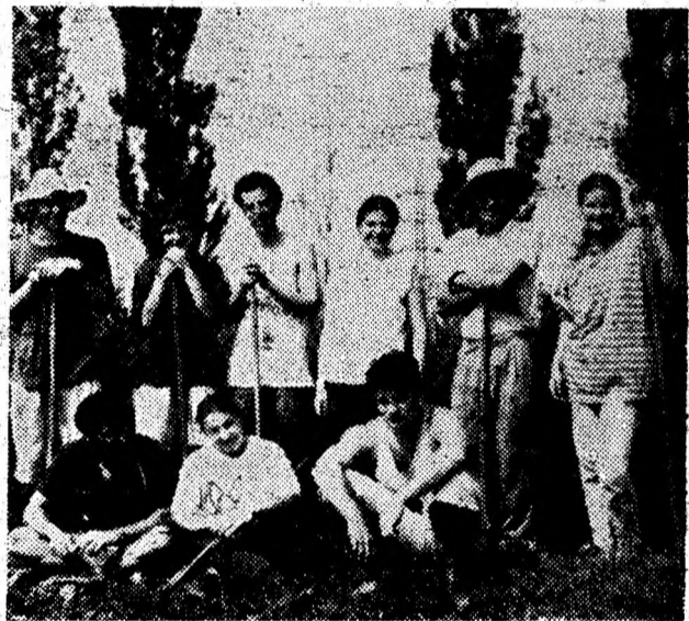
Un zâmbet în mijlocul naturii.