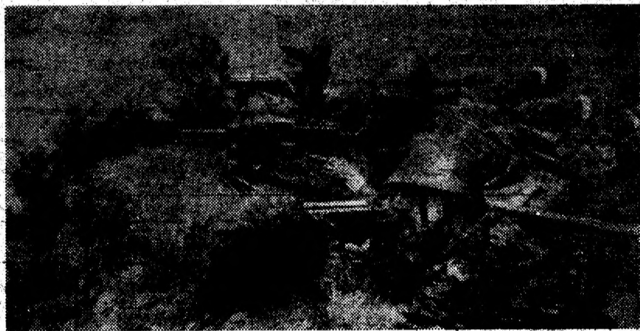
În lupta cu țintele, încă de la primele focuri, vânătorii de munte s-au dovedit a fi câștigători. Aspect de la aplicația militară din 2 iunie a.c., efectuată pe Muntele Găina.