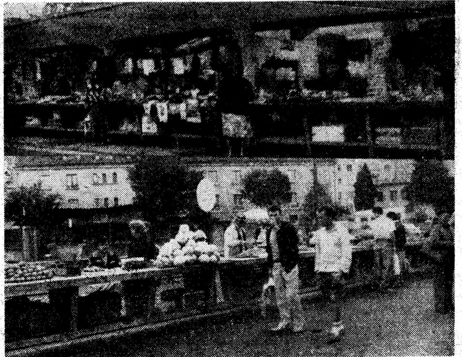
SIMERIA. Piața de alimente, reorganizată și reamenajată este ordonată și curată.

• Licitații, adjudecări. Consiliul local al orașului Vulcan a concesionat prin licitație publică 80 mp de teren situat lângă podul peste pârâul Morisoara și destinat amplasării a 5 chioșcuri. Concesionarea s-a făcut pentru taxe între 650 lei și 25 000 lei/mp/an și sponsorizări între 100 000 și 300 000 lei. A fost de unde alege: 15 ofertanți s-au prezentat să liciteze.