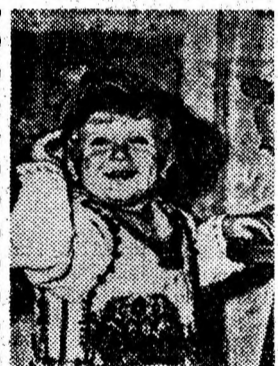
„AL MEU E CEL MAI FRUMOS”

În arsuri, muștelul se poate folosi sub formă de ulei, care se prepară astfel: 10 g flori sitate se umezesc cu o lingură de alcool. După câteva ore, acestui conținut i se adaugă 100 g ulei de floarea-soarelui și se încălzește pe baie de apă timp de 2-3 ore până ce alcoolul s-a evaporat. În acest timp, uleiul se amestecă adeseori. Se strecoară și se stoarce. Uleiul obținut se păstrează în sticle colorate și la rece.