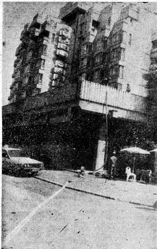
DEVA. Hotelul „Sarmis”