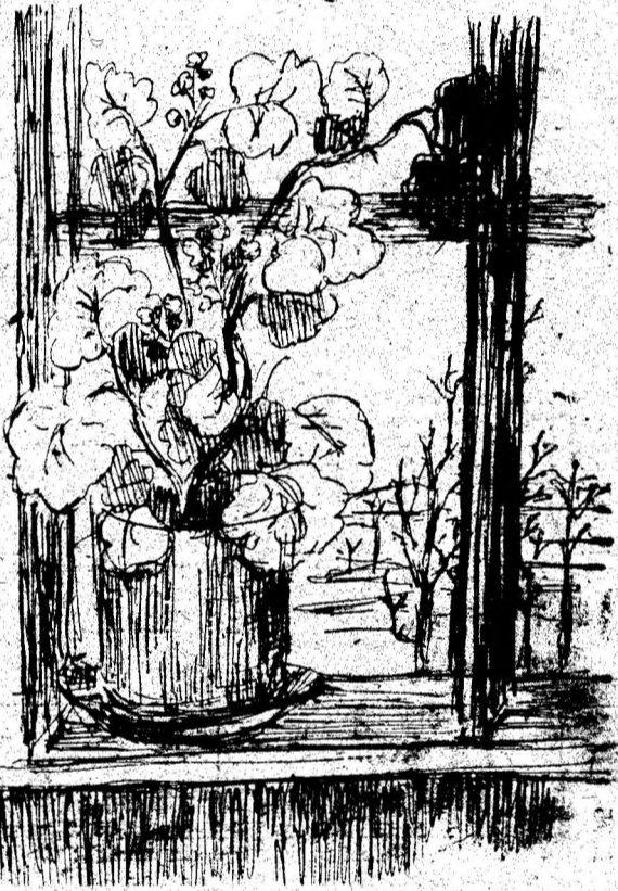
„MUSCATA”