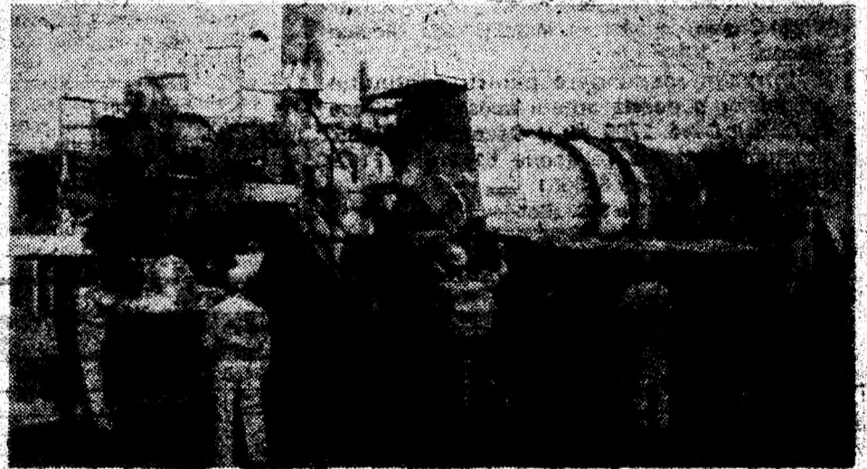
Lucrările de modernizare a drumurilor în zona municipiului Deva se desfășoară cu intensitate.