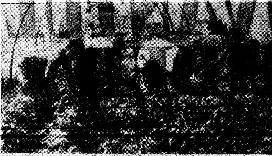
S.C. „Horticola” Deva Din solarii se culeg ardeii grași, care iau drumul pieței.

culă densă de praf negru și acid, să intre în apă albă și să iasă... negru? „Lingura romană” săpată în stâncă — pe vremea când nu se cunoștea dinamita și săpăturile se efectuau prin aducerea la incandescență a rocilor, prin focuri mari și stropirea ulterioară cu apă rece — rămănea amintirea unui trecut definitiv în uitare. O idee a venit, totuși, cuiva. Să se cultive, în bazin acoperit, în apele termale, o algă, un fel de varză de apă, care să fie folosită în furajarea animalelor din zootehnia colectivităților, care de ani de zile se află în delicat de furaje, iar bietele animale nu mai primeau decât „apă, paie și lătafe” — cum spuneau cu umor oamenii, care le îngrijeau, amărâți și ei. Sau făcuseră eforturi, s-au cheltuit bani, dar varza de apă nu a putut ține loc pășunii, concentratelor și fânului... (Va urma). TIBERIU ISTRATE