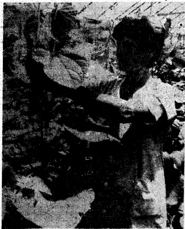
La fermele de legume ale S.C. „Horticola” S.A. Deva, se anunță o recoltă bună de castraveți.

Dacă lucrările din agricultură sunt făcute an de an în bune condiții, rezultatele se datoresc în bună măsură acoperirii volumului acestora în proporție de peste 80 la sută cu mijloacele din dotarea proprie. Tendința și dorința este de a dezvolta patrimoniul și dotarea tehnică, astfel încât în viitor prestațiile să se realizeze pe cât posibil în totalitate cu mijloace proprii.