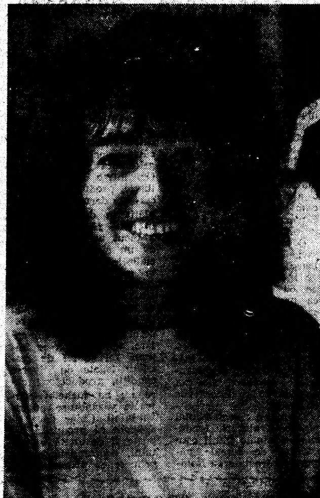
Un zâmbet de la Hunedoara.