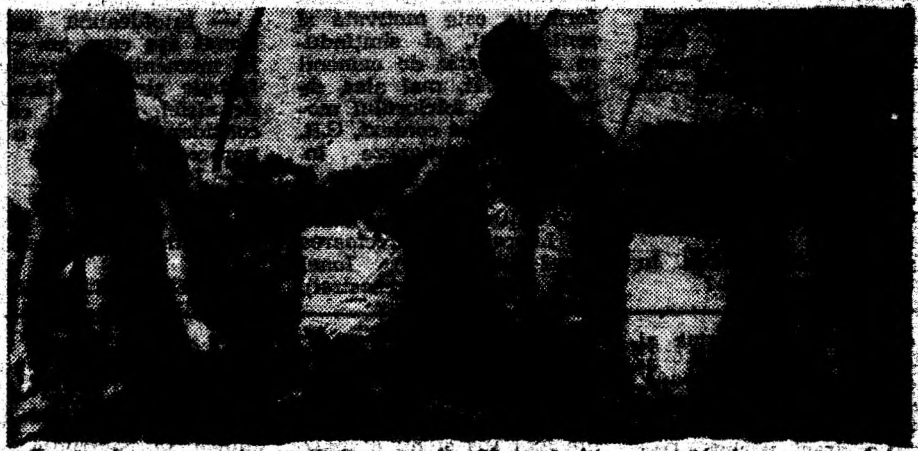
De la ferma nr. 4 a S.C. Sansere din Sintandrei se pregătește un nou lot de legume, care la drumul piețelor hunedorene.

Bine ar fi ca din neajunsurile de până acum oamenii să tragă învățăminte, să știe cum aplică tehnologiile, cum valorifică recolta și care este modul mai profitabil de a vinde surplusul de produse.