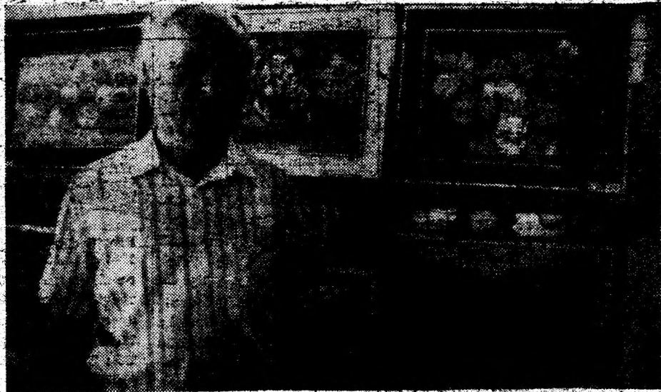
Aspecte din expoziția de artă plastică Ion Ratz, deschisă la Brad.