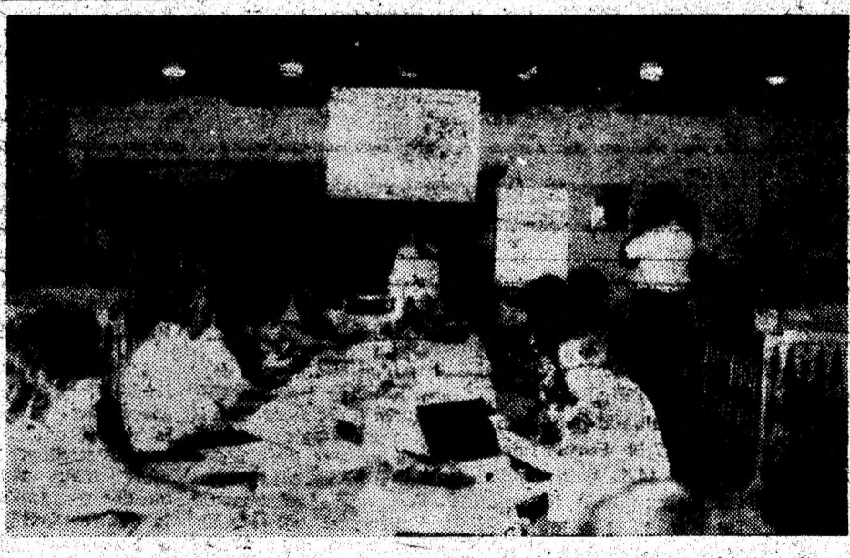
Seminarul a debutat cu prezentarea sistemului de telecomunicații din țara noastră, preocupările actuale și de perspectivă ale dezvoltării sale.

UNA PE ZI — Fii atent, că era să intrăm într-un copac! — Cum, nu conduci tu?!