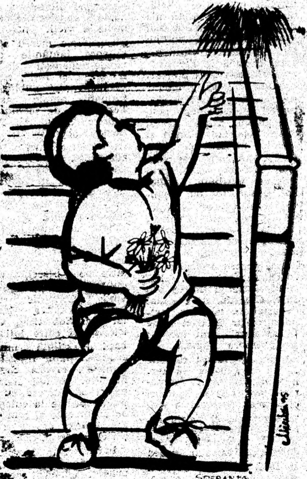
Desen de MARIA MIERTOIU

Principala măsură de prevenire este asigurarea băltoacelor, a inundațiilor din subsoluri sau turnarea de petrol lampant care să acopere aceste ochiuri de apă cu o peliculă continuă. Pentru a evita pătrunderea țânțarilor în încăperea, folosim următoarele procedee: • se stinge lumina în casă și se aprinde o lumină afară; • se montează la ferestre plase fine sau pânze de tifon; • punem într-o farfurie câteva picături de esență de lavandă; • ținem în casă un ghiveci cu hănuț; • punem câteva coji de portocală pe o tăblică încinsă pe care o ținem la foc mic; • presăram peste o țigărie încinsă puțin camfor și o plimbăm prin încăperea pentru ca fumul să se împrăstie. Există, desigur, și alte posibilități să scăpăm de țânțari, ca de exemplu dezinfecția apartamentului sau a casei (care ne scapă de insecte o perioadă mai lungă), multe alte produse mai vechi sau mai noi ce se găsesc în comerț. Pentru a preveni pișcăturile de țânțari, frictionăm pielea cu oțet sau infuzie de levănțică; se mai poate folosi vaselină mentolată. Dacă ne aflăm în aer liber, într-un mediu cu mulți țânțari, este indicat să purtăm haine de culoare închisă. Pentru îndepărtarea acestor insecte, se aprinde un foc de ramuri verzi, cu cât mai mult fum. (Dar cu multă atenție!).