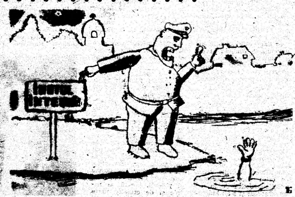
Desen de FLORIN ARON PĂDUREAN — Deva