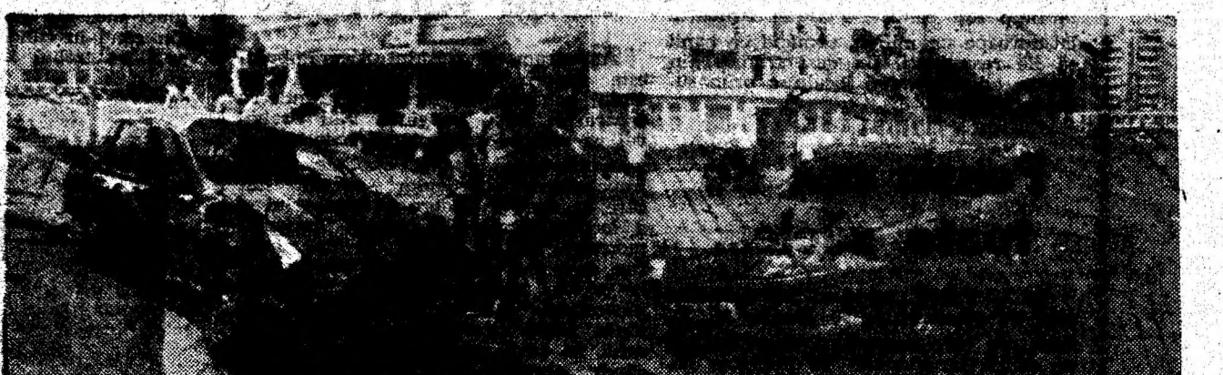
În intersecția de la Hotelul Lido din Deva, carambolurile cu autoturismele — cum se vede și din această fotografie — au loc din cauza neatenței șoferilor la semnalizările rutiere.

mea. Muncă ca un bolond. Până ziceam eu ho. Tu și Ioan. Ziceam noaptea că te voi, când îngăduia cuptorului; puneți capul jos un pic, voi nu și nu. Oțel! — Nea Enache, lecția de oțelărie a prins bine. — Se vede, ziaristule. Hai. — Unde? — Dau o dublă. Așa se cinsteau oțelarii pe vremurile noastre. Șarja, șarjă, oțelul, oțel, dubla, dubla... Omu-i om la toate. — Dar cum era cuptorul trei pe vremurile noastre? — Nu cuptorul trei — Oțelăria nouă, mă. Birtărie, nu alta. — Și Nea Enache, când mai mergeam noi la cuptorul trei? — Eu? Am feciorul acolo. Prim-topitor. Tu ai plecat. Eu am rămas la O.S.M. II. Caută-l pe prim-topitorul Enache... GH. I. NEGREA