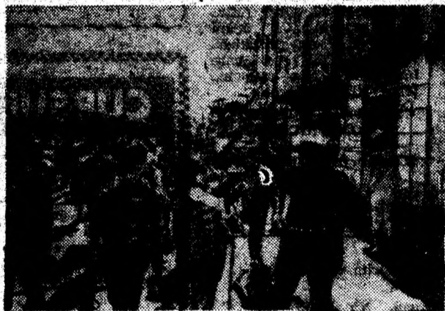
Fanfara în acțiune.