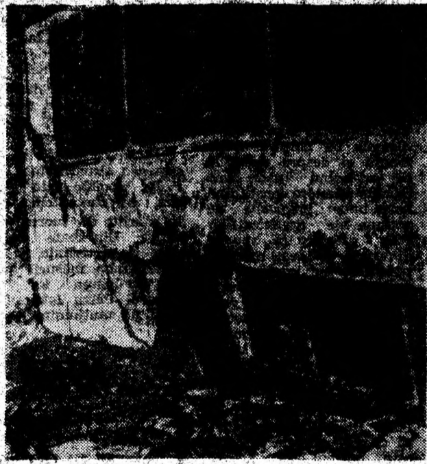
Ce a mai rămas din autocar.