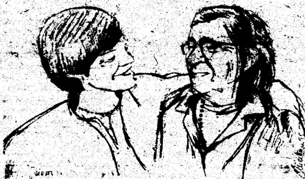
Vârstele. Desen de MARIA MIERTOIU, Deva

• UNOR FETE IN MONOKINI Sunt june pe-ale mării plaje ce ne'nvăță, Ațățătoare legi ale tranzitiei carusel. Nu sunt defel legi ale economiei de piață, Ci doar, ale economiei de... sutiin. ADRIAN SALĂGEAN