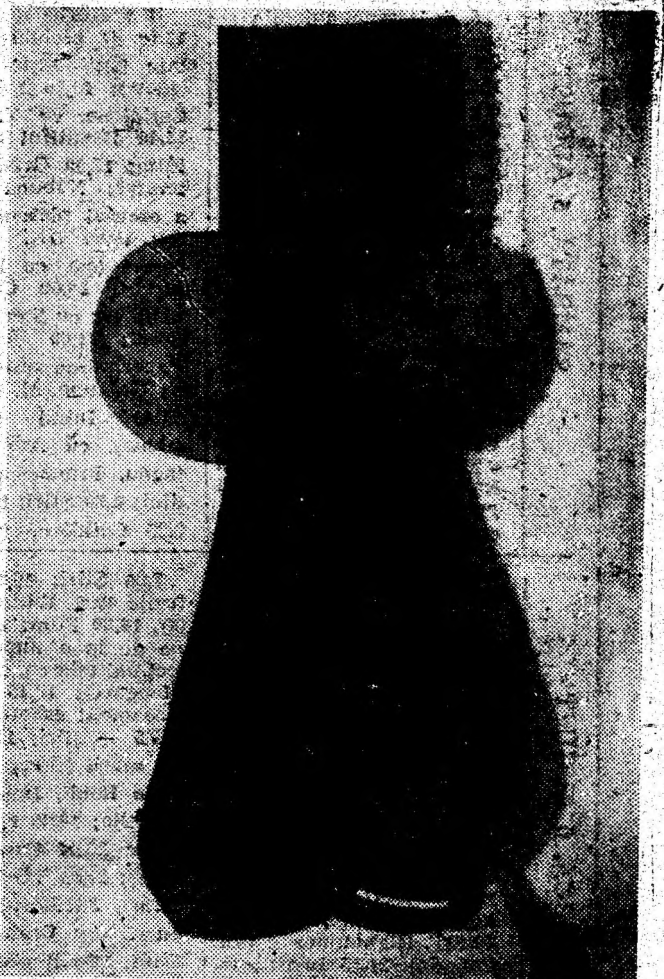
La Galeria de artă „Forma” din Deva se află deschisă expoziția de sculptură a cunoscutului artist Ioan Șeu. Creația sculptorului a lăsat o bună impresie publicului devenean, dovadă afluența acestuia în galerii de la vernisaj încoace. În fotografie — o lucrare în lemn realizată de sculptorul Ioan Șeu.