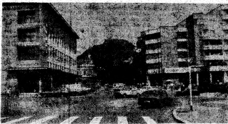
Vedere spre cetatea Devei.