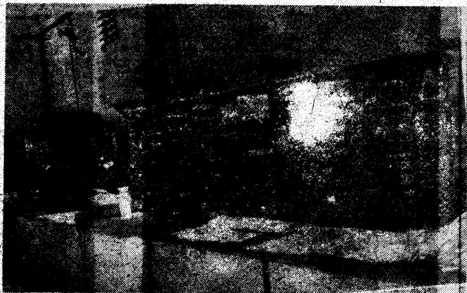
„Dema” este denumirea noului magazin-depozit deschis de curând la S.C. Sarmintex S.A. Deva.