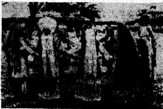
Ansamblul „Authentic folklore” din Plovdiv (Bulgaria).