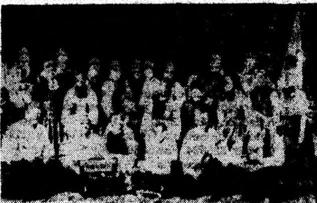
Grupul folcloric „Ramsø” al Companiei Fiddler (Danemarca).