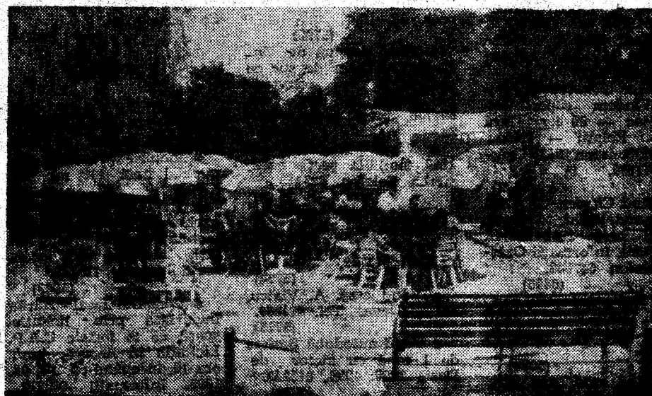
Terasa de vară.