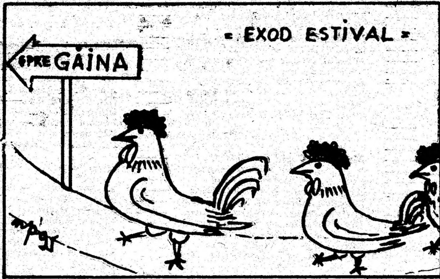
Desen de IOAN PRODAN — Hațeg.