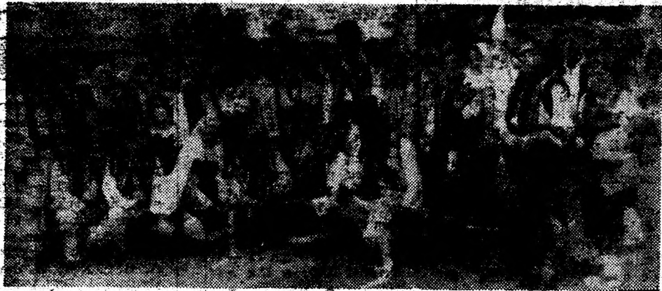
Ansamblul folcloric „Dragos Vodă“ din Cernăuți (Ucraina).

Ploile din ultimele zile ne îndeamnă să ne îndoim puțin asupra timpului care oricât ne-am strădui... „probabil“ rămâne. Să sperăm că acest „probabil“ va însemna frumos pentru duminică la Costești. Astfel, ca încheierea Festivalului Folcloric Internațional „Sarmizegetusa“ să se producă pe scena amenajată în aer liber, în neasemuitul amfiteatru natural de la poalele cetăților dacice din Munții Orăștiei. Pentru că nu poate fi nimic mai frumos decât un spectacol