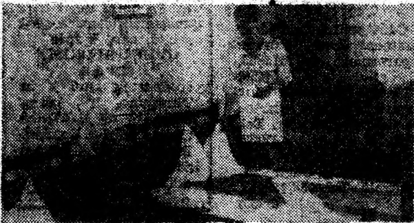
Un ambient plăcut, o servire ireproșabilă: Hotel „Rusca”.

D.C.: Aveam întocmită toată documentația în vederea privatizării prin metoda MEBO. Am trecut prin toate „furcile caudine” ale întocmirii acestei documentații, cuprinzătoare de evaluări și para-evaluări. Firește totul contra cost. Pe urmă, conform HG 834 din 1991, am obținut actele doveditoare ale proprietății asupra terenului. Întocmirea acestora a însemnat alte două milioane lei adăugate la buche-tul cheltuielilor. Și pe urmă, a căzut ca o lovitură de trăsnet HG 500 din toamnă lui 1994. Aceasta ne-a obligat la reevaluarea capitalului social. Aplicarea