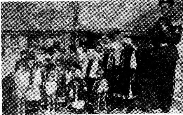
Aspect de la slujba de pomenire

jocului și portului nostru popular, Marioara Murescu.