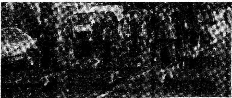
Pădurea din Dăbâca la Festivalul folcloric internațional „Sarmizegetusa”.