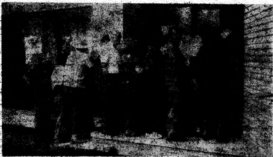
La punctele de distribuție din Deva, în prima zi mulți din cei îndreptății și-au ridicat cupoanele.