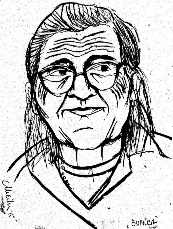
Desen de Maria Mierdu.

● Să le facem copiilor noștri viața mai ușoară, nu mai comodă.