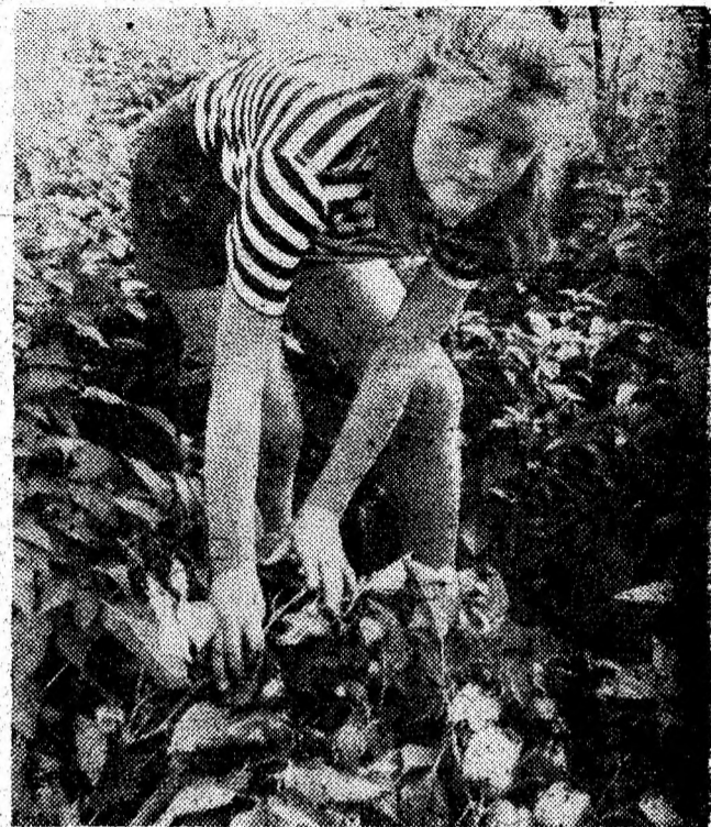
La cules de ardei