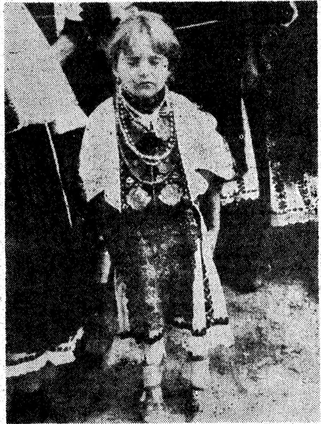
„Mândră mi-s că s pădureancă”.