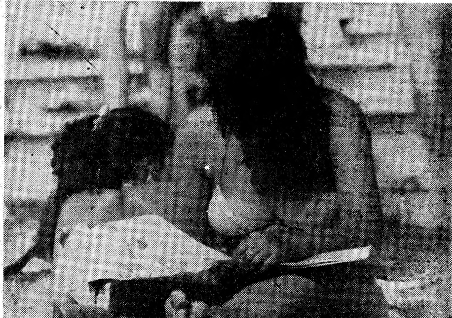
În orice ocazie, citiți „Cuvântul liber”