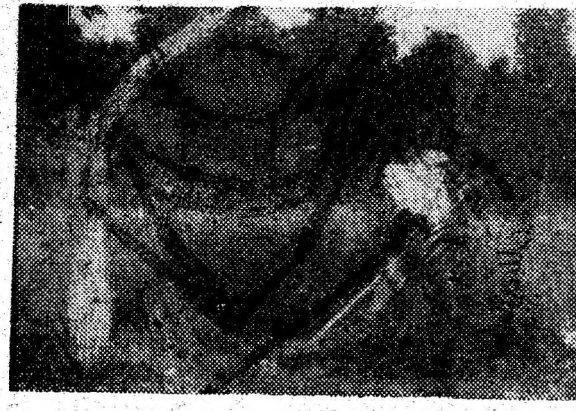
Tot la coasă ai rămas!