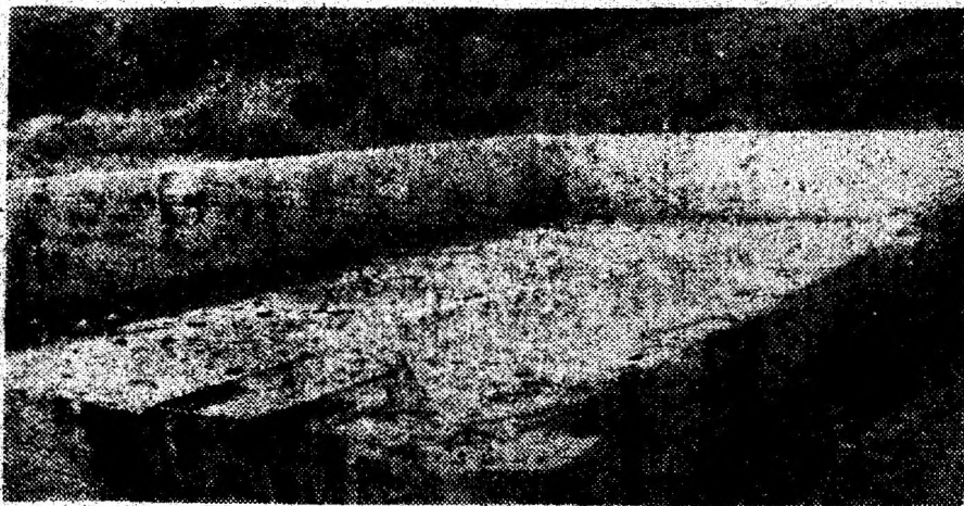
Un posibil popas turistic. Se așteaptă întreprindă torii, care să finalizeze hotelul și bazinul cu apă minerală de alături.