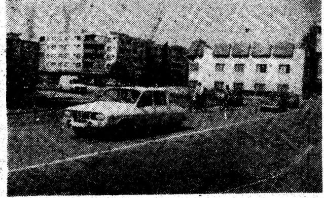
Vedere din orașul Brad.