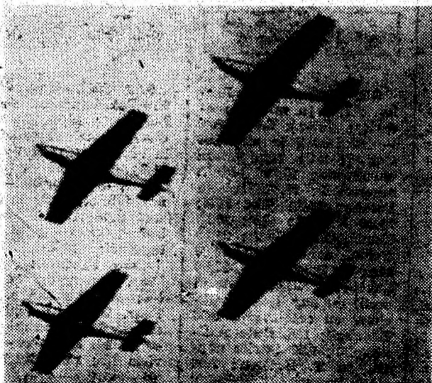
Prin dimensiunea evenimentului de sâmbătă, 9 septembrie a.c., desfășurat la Săulești — Deva, Aeroclubul Dacia din localitate a trăit mo-

mente deosebite care se inscriu cu litere majuscule în memoria timpului; împlinirea a două decenii de la reînființarea aeroclubului; 85 de ani de la primul zbor al pionierului aripilor românești, Aurel Vlaicu și nu în ultimul rând ca importanță inaugurarea Complexului Internațional de Pregătire a Aviației Sportive.