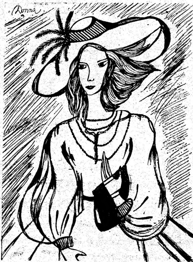
„RAPHAELA” — Desen de Donna (Agnes Szasz)