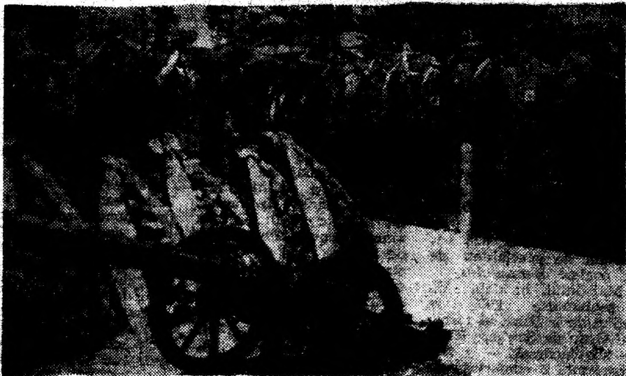
Se depun coroane de flori la mormântul marelui erou al neamului Avram Iancu.