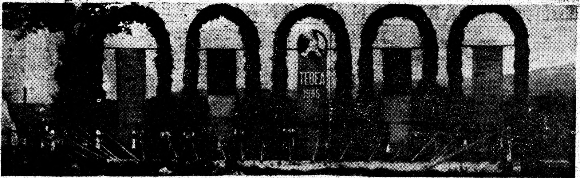
Tâlnicăreşele inaugurează spectacolul închinat Iancului.