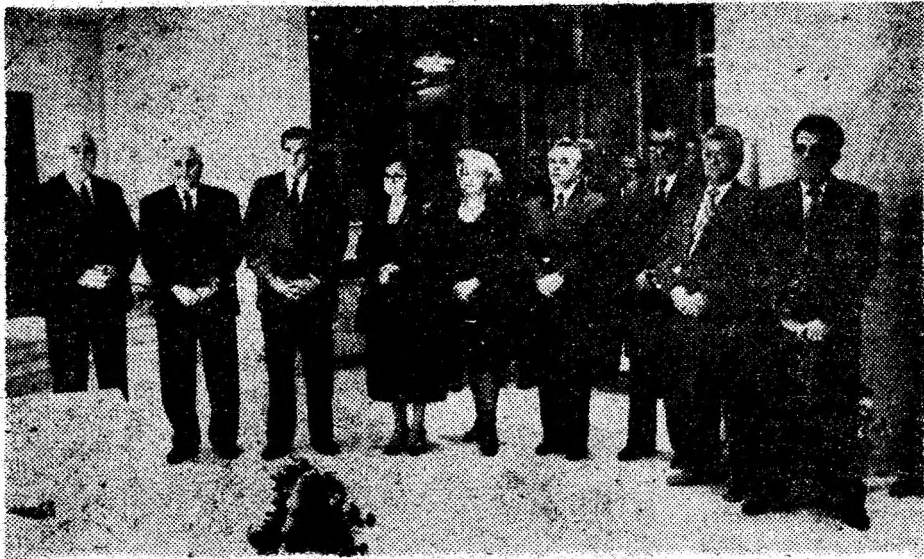
Participanți la festivitatea de inaugurare a noului sediu al Băncii Co- merciale Române.