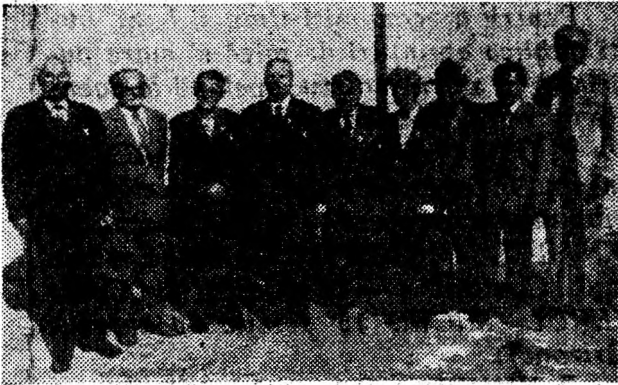
Veterani de război, arma pompieri care au primit cu prilejul Zilei Pompierilor medalia „Crucea comemorativă a celui de-al doilea război mondial, 1941—1945”.