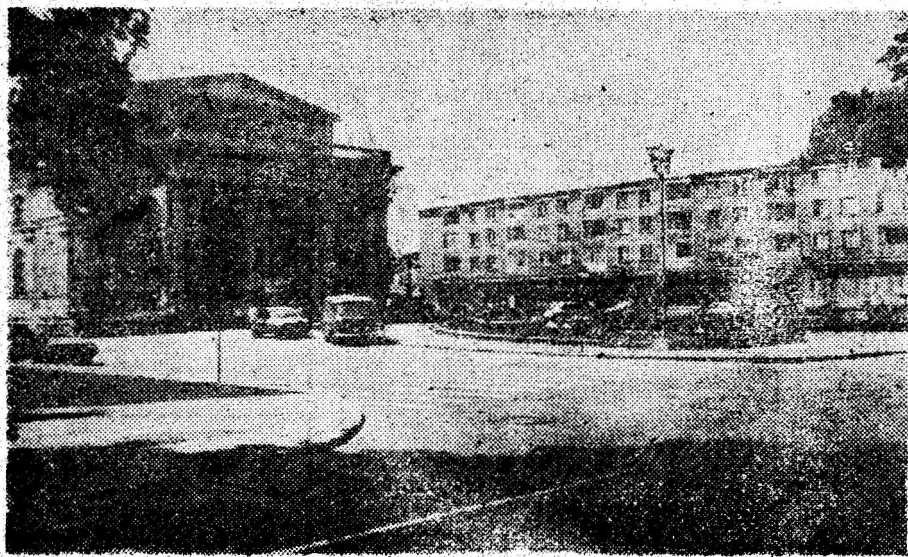
Hunedoara — Casa decultură.