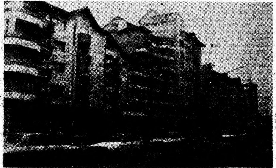
Imagine din Simeria.