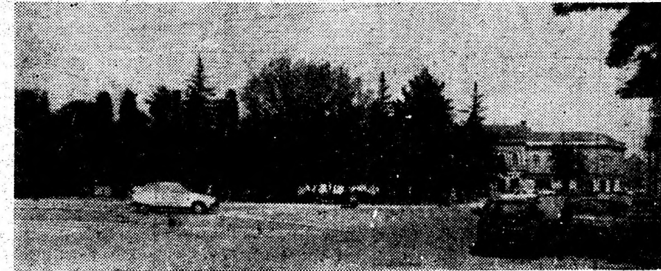
Hunedoara. Imagine din centrul vechi.

• Șeful o laudă pe noua sa secretară: — Bravo! Ați făcut numai 3 greșeli! Să trecem acum la cel de-al doilea cuvânt!