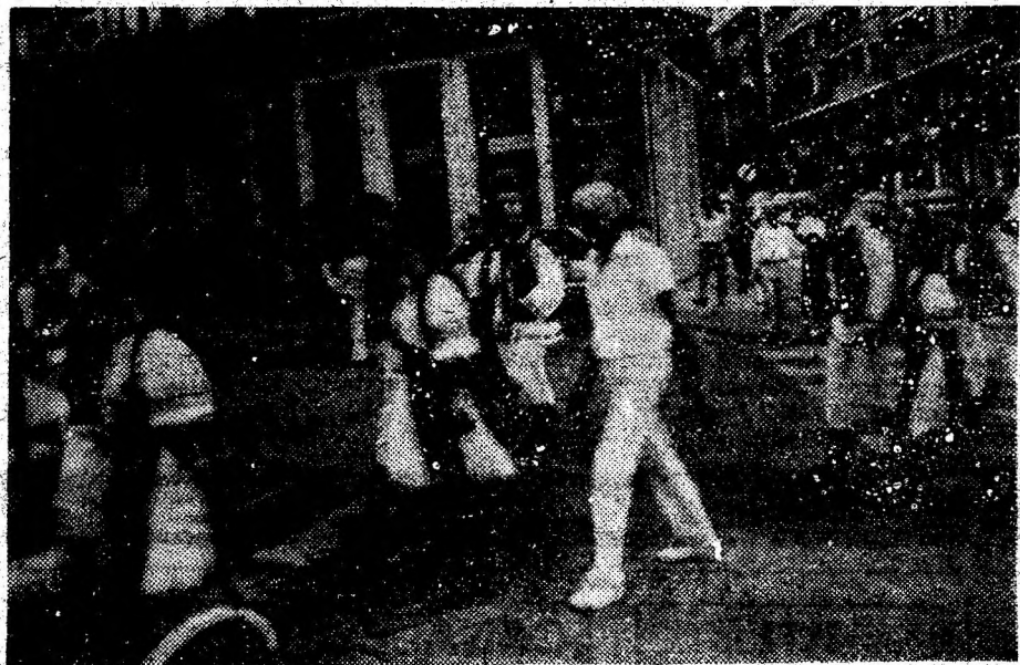
Membri ai ansamblului folcloric „Getusa” într-o paradă a portului în orașul Santurtzi, gazda festivalului.

● FESTIVALUL INTERNAȚIONAL „GEORGE ENESCU” — ACORD FINAL. Început în data de 7 septembrie a.c., în sala „Al. I. Cuza” de la Parlamentul României, Festivalul Internațional George Enescu și-a coborât cortina finală a celei de a XIII-a ediții, sâmbătă, 23 septembrie a.c. Concertul de închinare a prilejuit reînălțarea publicului meloman din București cu reputatul dirijor Sergiu