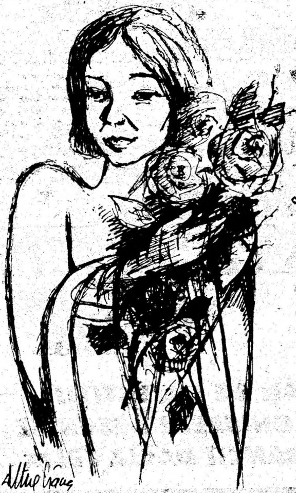
„De ziua ta”. Desen de DORINA ITUL CRANG.

MAXIMA ● Toate pasiunile sunt amăgitoare; ele se feresc de ochii altora și se ascund de ele însele. DE LA BRUYERE