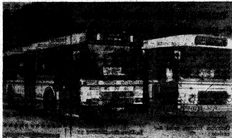
Autobuzele primite cadou din Franța de către Primăria Deva cu care se efectuează transportul gratuit al elevilor.

În continuare, este necesară elaborarea Studiilor de fezabilitate și fezabilitate, pentru a fi supuse aprobării Direcției generale programe investiții publice și expertizarea investițiilor publice din cadrul Ministerului de Finanțe și Consiliului interministerial de avizare lucrări publice de interes național și locale sociale.