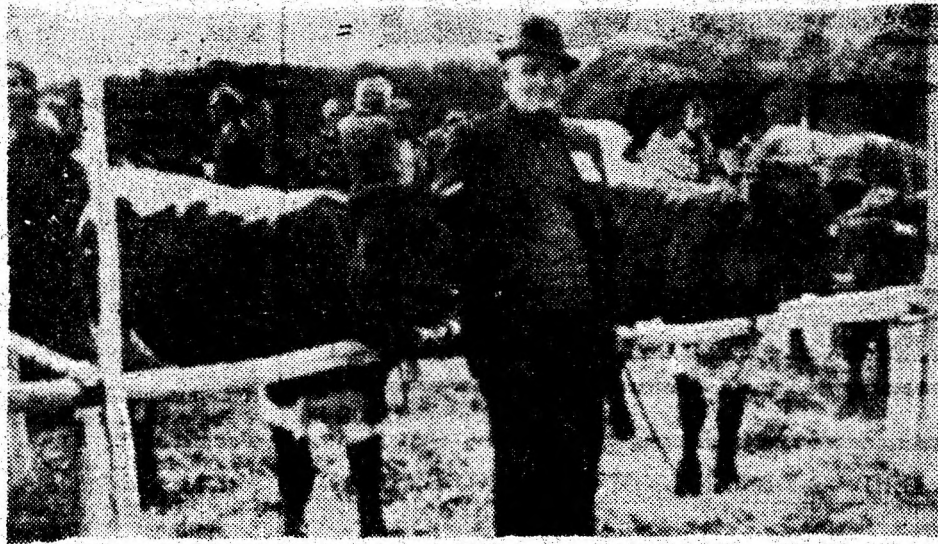
Unul dintre vrednicii crescători de animale din rasa Pinzgau, care a fost premiat pentru exemplarele crescute în gospodăria personală.