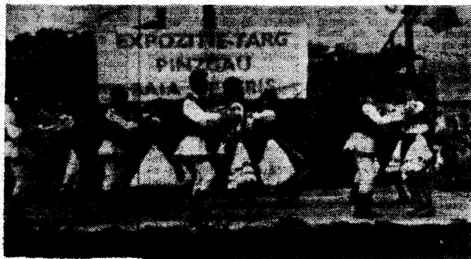
Un scurt moment folcloric, înainte de venirea ploii.

În ciuda vremii potrivnice, expoziția-târg care a avut loc duminică la Baia de Criș, într-o organizare de excepție, s-a constituit într-o reușită manifestare propagandistică în favoarea revigorării rasei de bovine Pinzgau. Pe lângă mândria crescătorilor de animale care au participat cu cele mai valoroase exemplare crescute în gospodăriile particulare, toți primind premii și diplome, grație și aportului unor sponsori generoși, am remarcat că expoziția s-a bucurat de un real interes în rândul tuturor celor ce au fost prezenți la cea de-a doua ediție a acestei manifestări. La expoziția-târg din acest an am notat prezența a numeroși specialiști din agricultura județului