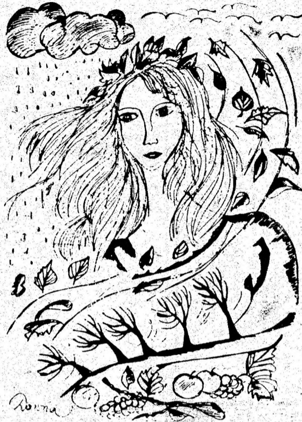
„Toamna”. Desen de DONNA (SZASZ AGNES) — Hunedoara.