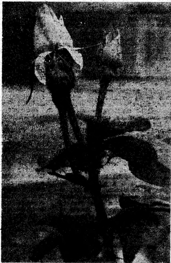
Semn de toamnă lungă.

forme oarecum asemănătoare cu ale ostașilor din trupa respectivă, dar diferențiate prin fuste și șorturi puse peste pantaloni. Funcția de vivandieră era cunoscută încă din secolul al XVII-lea, în Franța. Aceste femei-ostași aveau misiunea de a însoți trupele în deplasare, la manevre și în campanii, spre a le servi alimente și băuturi.