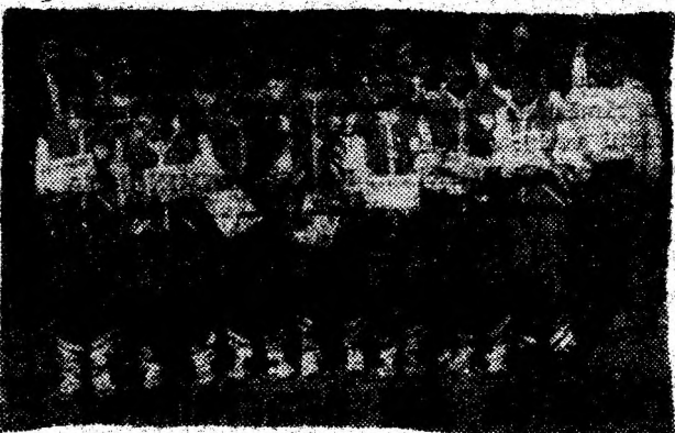
Lotul campionilor hunedoreni.