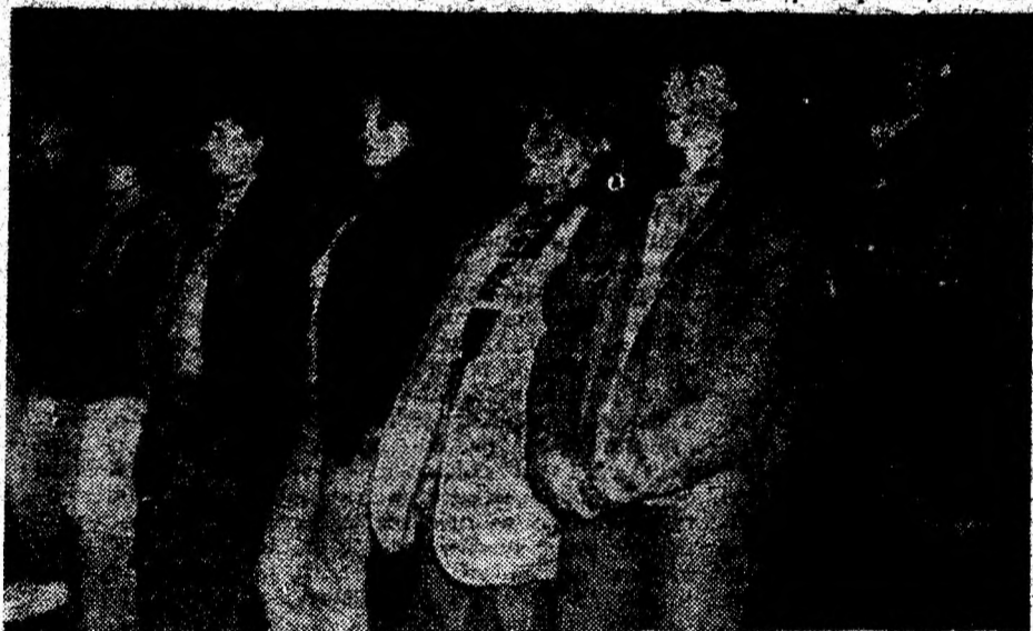
Aspect de la deschiderea noului an universitar la Universitatea Ecologică Deva