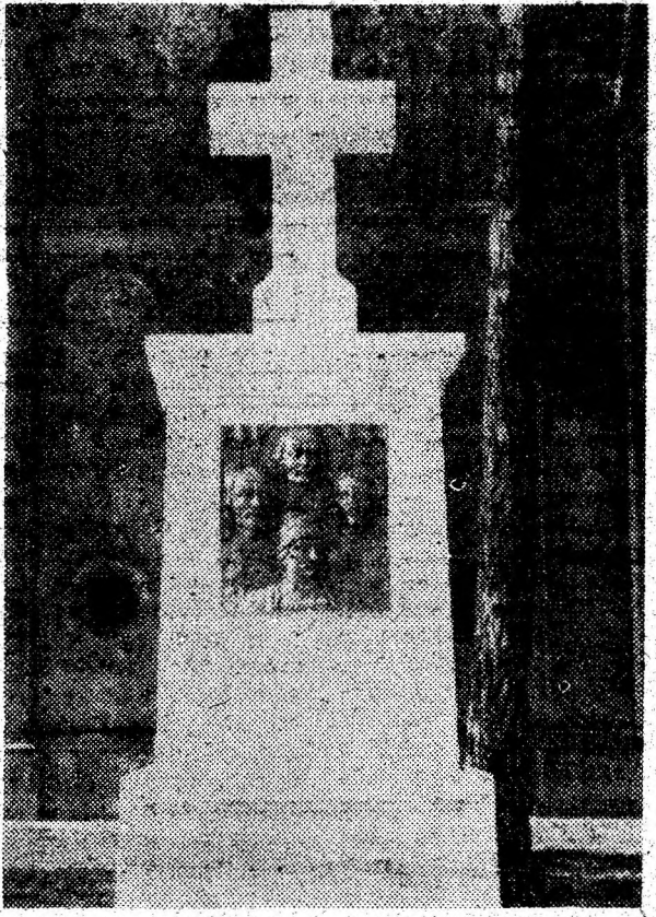
„Monumentul Tuturor Eroilor Neamului” dezvelit ieri la Deva.