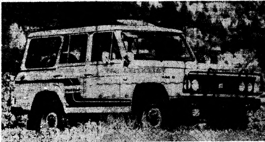
Un exemplar ARO 244D din expoziție.