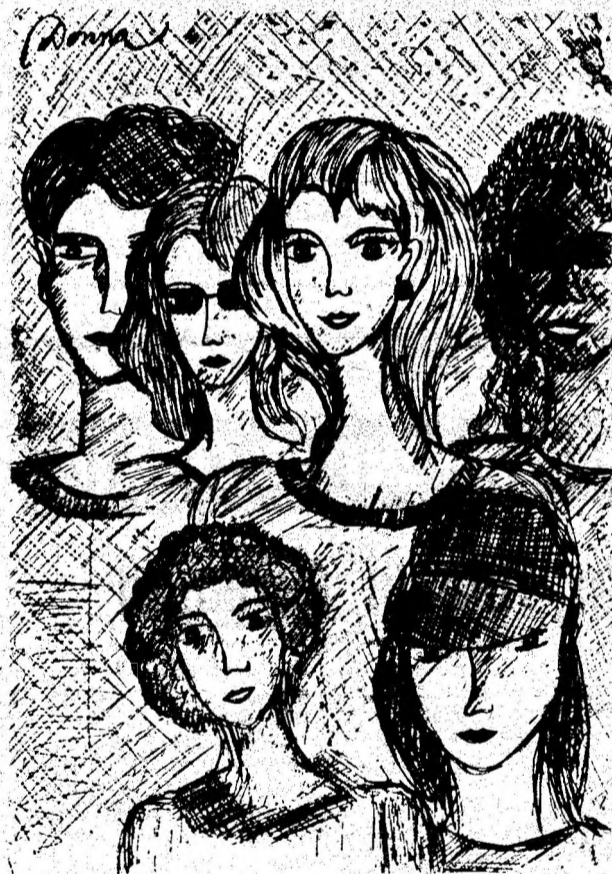
CONCURSURI CU PREMII: Desen de DONNA (Szasz Agnes) Hunedoara.