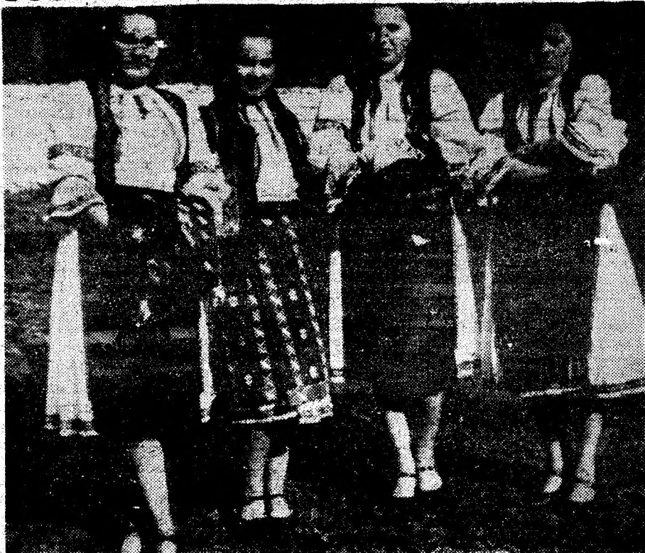
Moașele sunt mândre de costumele lor sobre și elegante.