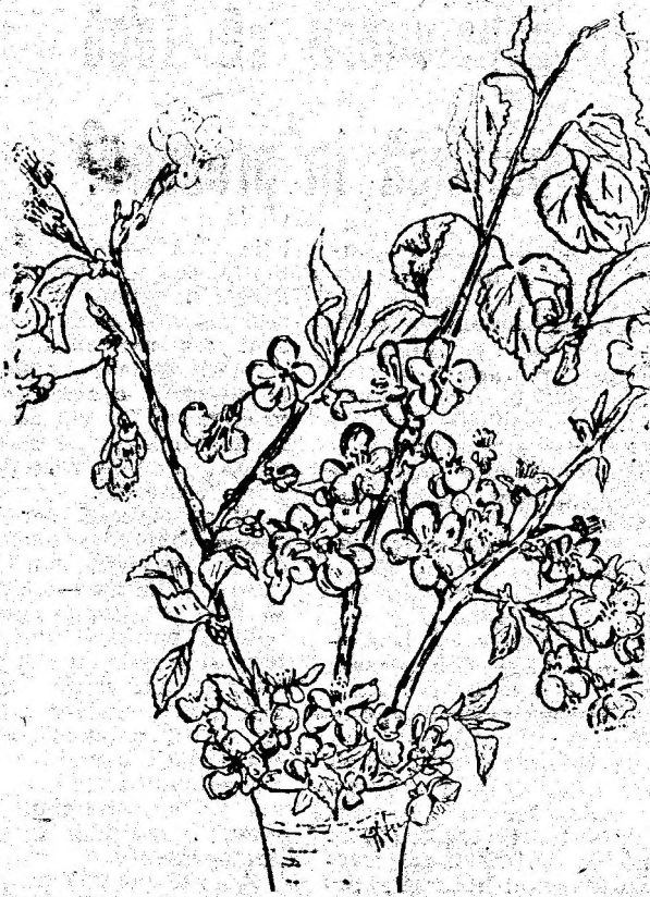
Biciuși de vântul rece al toamnei, pomii visează primăvara. Desen de ELISABETA PETEA

◆ Când tricotați ceva în mai multe culori, pentru a nu se incurca firele, puneți ghețele într-o pungă de plastic și le trageți prin găuri special făcute (pentru fiecare fir);