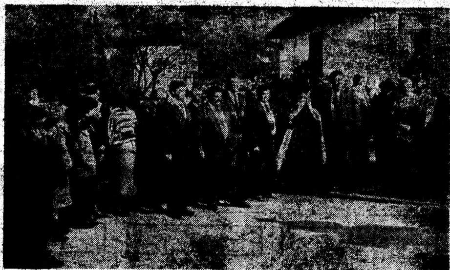
La Monumentul Eroilor neamului se depun coroane și jerbe de flori.