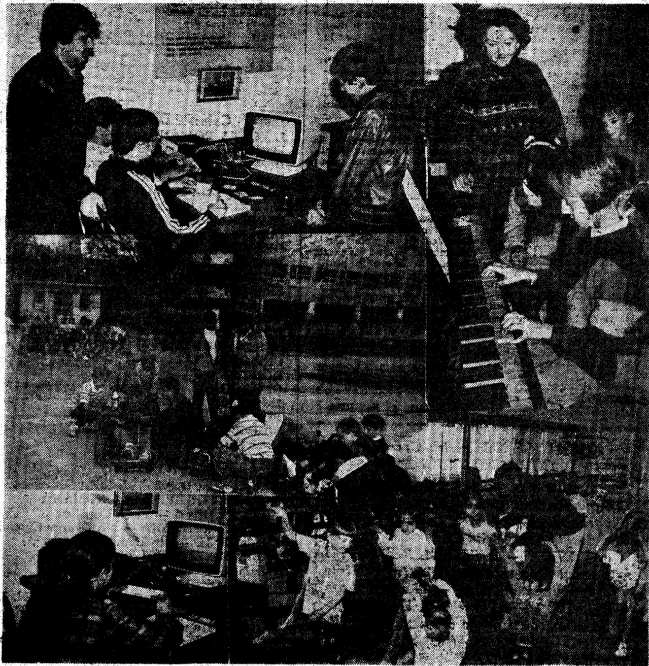
Fotomontaj de SANDU CAZAN

Bogata activitate ce se desfășoară la Clubul copiilor din Orăștie este ilustrată cu precădere de numărul însemnat de cercuri organizate aici, conduse de cadre didactice competente, cu dragoste pentru tineri. Putem menționa în acest sens: cercul de informatică-electronică, condus de prof.