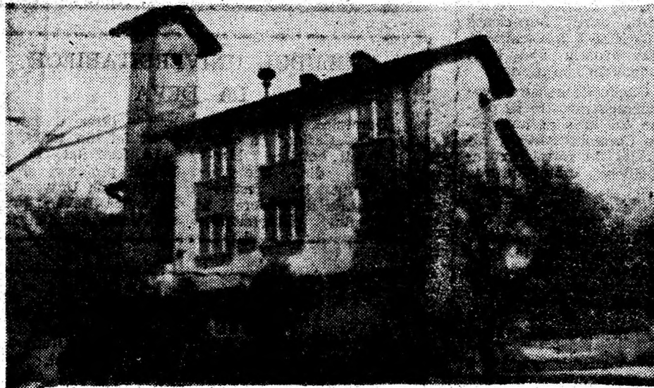
Cirjiți. Noul, modernul sediu al Consiliului local și al Poliției.