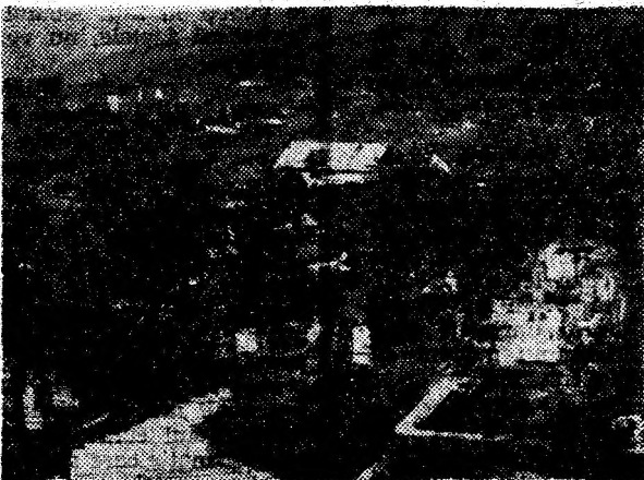
Vedere panoramică de toamnă spre Almașu Sec, comuna Cârjiți.

Au fost alese sau completate noile conduceri ale subfilialelor, s-au stabilit delegații la Conferința Filialei județene ce va avea loc la Deva la sfârșitul acestei săptămâni. (Tr.B.)