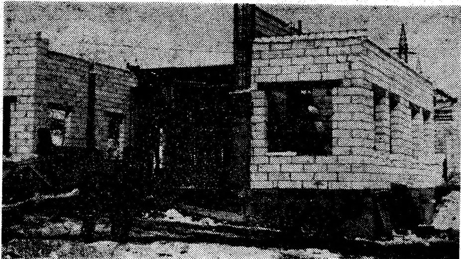
Premieră: La Bejan se înalță primul cămin cultural din istoria satului!

● Fiecare familie trebuie să achite 200 000 lei pentru realizarea studiului de fezabilitate și pentru proiectul de introducere a gazului metan. S-au alcătuit comisii pe sate ce se ocupă de treaba asta.