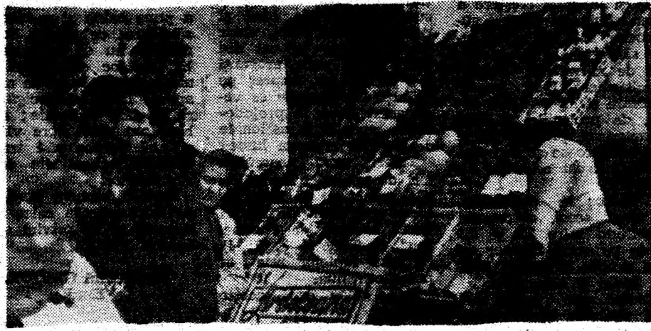
Nostalgie după produsele toamnei.

Rezultă cu claritate, deci, că în 1995 n-a fost decât un semnal la scandalul grâului ce va urma cu adevărat în 1996, când cu greu se vor acoperi nevoile de consum intern, disponibilitățile pentru export și aportul valutar fiind puse de pe acum sub semnul întrebării, o nădejde existând că vor mai rămâne, totuși, ceva rezerve din recolta acestui an.