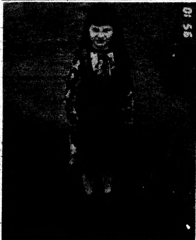
Să mai spună cineva că la Curechiu nu sunt fete frumoase...

O cunoscută firmă americană (cu filiale în întreaga lume), specializată în sondaje de opinie, a dat publicității, de curând, rezultatele ultimului său „chestionar”. Este vorba despre cum ar trebui să arate femeia perfectă în opinia bărbaților, la sondaj participând un eșantion reprezentativ de bărbați de pe tot globul. Raportată la femei celebre, înfățișarea acestei „Ilene Cosânzene” ar trebui să aibă: ● ochii lui Isabelle Adjani; ● picioarele lui Kim Basinger; ● gura și sânii lui Marilyn Monroe; ● părul Emmanuelle Beart. Unde o fi femeia asta?