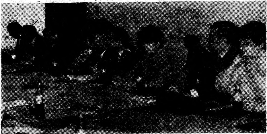
Aspect din timpul desfășurării simpozionului de la Deva dedicat sărbătoririi a 125 de ani de la înființarea Societății pentru Fond de Teatru Român.