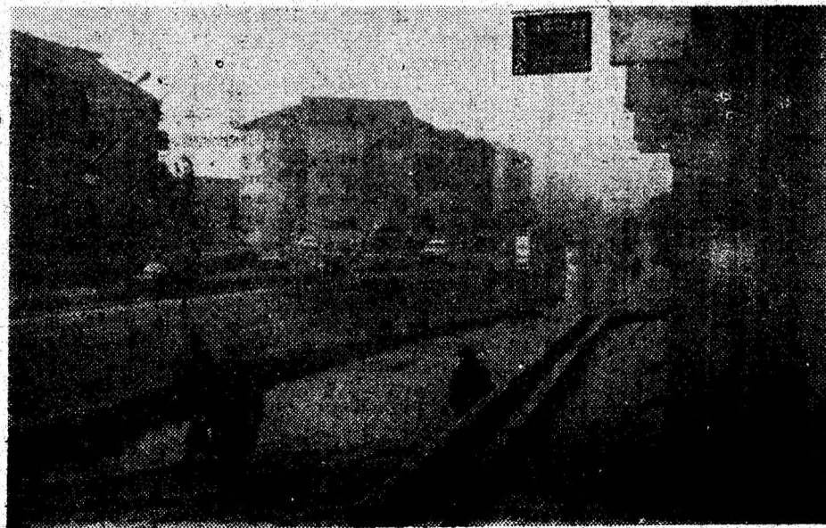
Dimineață cețoasă în Orăștie. Vedere de pe Bdul Unirii.