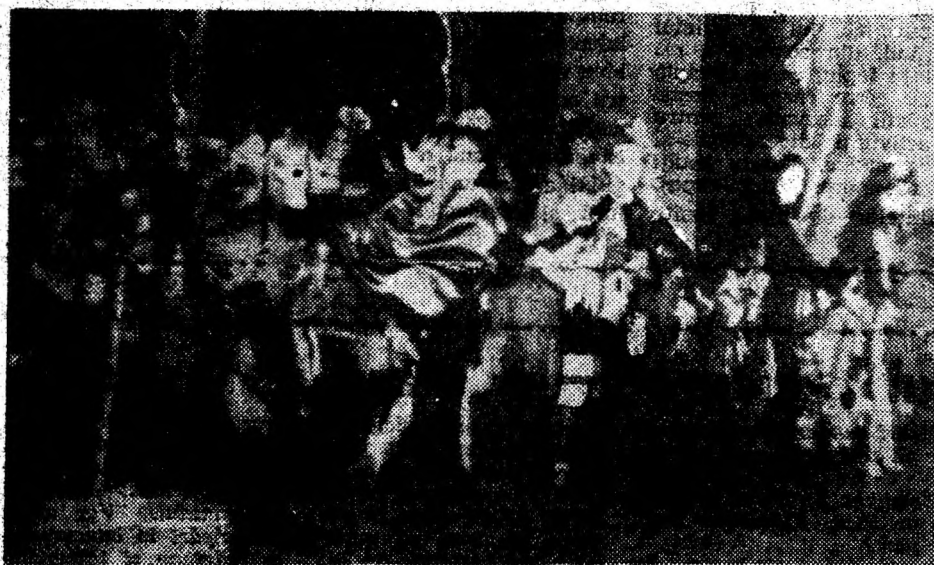
Aspect din timpul premierei „Revista 'n draci” a Teatrului de Revistă Deva.