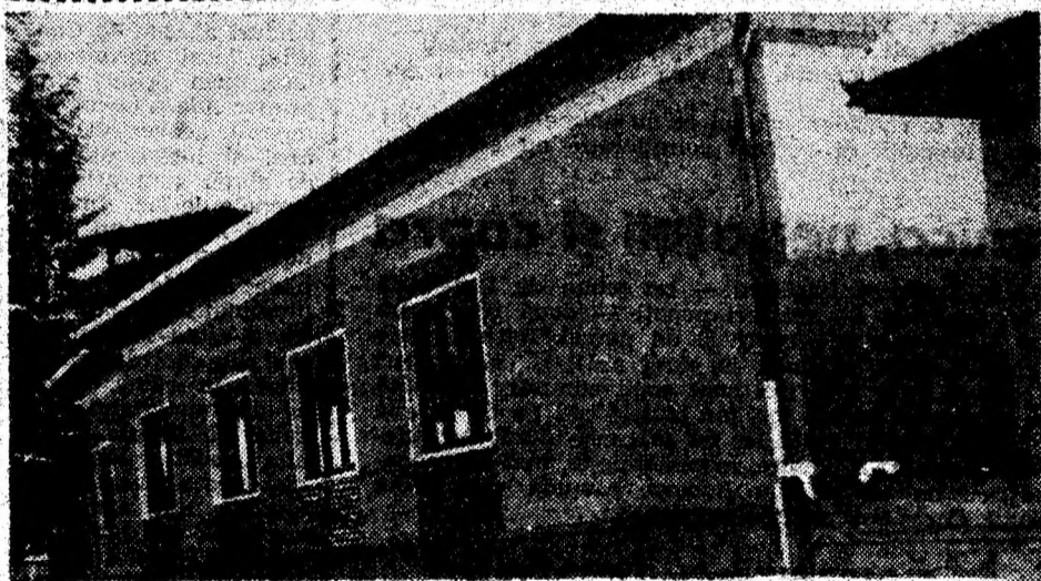
Școala din Boholt își primește elevii primenită, încălzită, bine pregătită de iarnă.

Județul nostru este puternic industrializat, astfel că teritoriul său este împânzit de rețele electrice de tot felul. Cineva — un cunosător, evident — asemeniia patenjeniușul de cabluri ce se duce sau vine din toate direcțiile cu sistemul circulator al organismelor vii. Și nu credem că exagera. Prin rețelele electrice aeriene circulă energia electrică produsă la Mintia, Rău Mare-Retezat etc., spre agenții economici și în casele oamenilor.