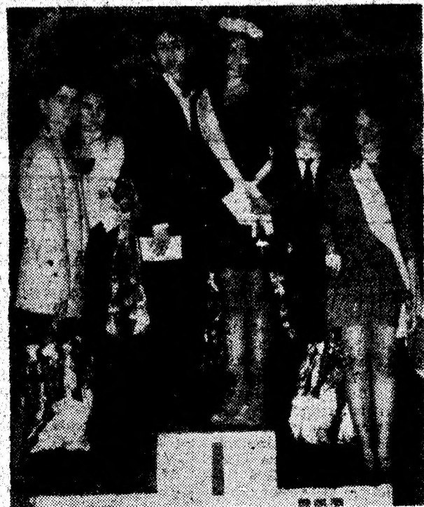
Câștigătorii concursului „Miss Deva 1995”: locul I — Liceul „Sabin Drăgoi”; locul II — Liceul Teoretic „Decebal”; locul III — Liceul Sportiv.