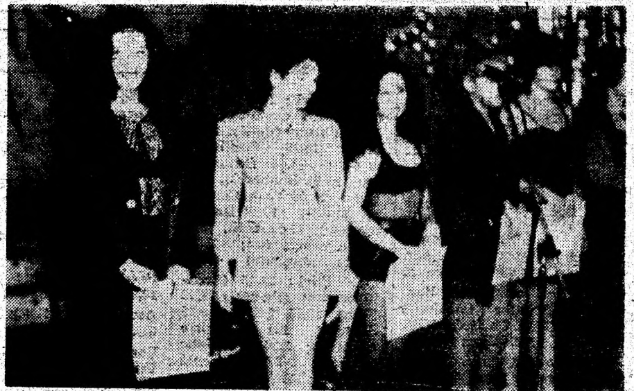
Laureatele festivalului - concurs de muzică ușoară „Stelele cetății” desfășurate la Deva.