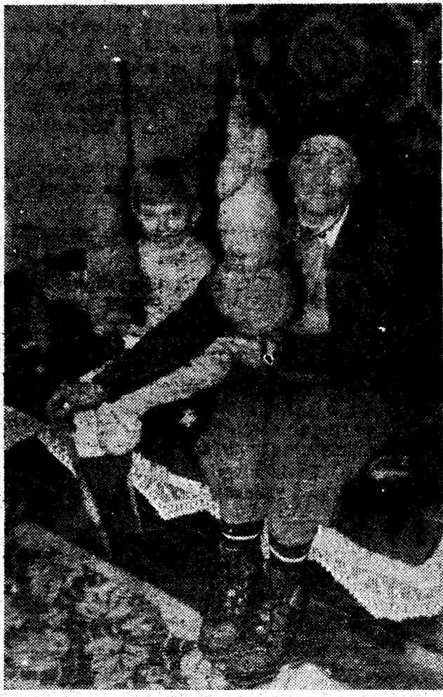
E iarnă. Bunica a scos din colțul lor furcile și fusele. Degetele i se mișcă repede-repede pe firul de lână. Numai ochi și urechi nepoata ascultă și învață pentru a fi la fel de vrednică și pricepută ca și bu- nica.