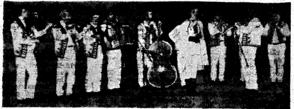
Ansamblul de muzică populară „Doina Crișului“ al Casei de Cultură din Brad, în spectacolul festiv dedicat Zilei Naționale a României.

Peste Maica României Mari, peste Cetatea de Scaun a Unirii s-au lăsat umbrele serii, cerul fiind împurpurat de jocurile de artificii, care au dat culoare și măreție Sărbătorii Naționale a României.