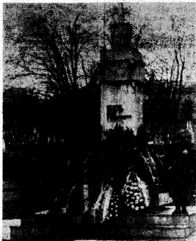
Coroane pentru eroi.